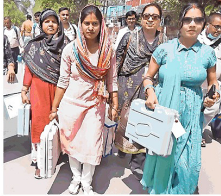
बरेली के परसाखेड़ा से निकलती महिला मतदानकर्तियों की टोली। तेज बूथ और गर्मी की परवाह किए बिना वे अपनी जिम्मेदारी निभाने निकल पड़ीं।

मतदाताओं की दृष्टि से सबसे अधिक वोटर आगरा (20,72,685) में और सबसे कम एटा (17,00,524) निर्वाचन क्षेत्र में हैं। मतदान के लिए 25,819 ईवीएम कंट्रोल यूनिट, 25,819 बैलेट यूनिट