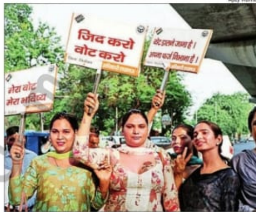
ONE FOR THE NATION A voter awareness rally was taken out by a group of transgenders in the city on Monday

Political observers believe Rajnath has good support from Muslims, especially Shias, apart from commoners due to his inclu-