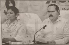
■ मेडिकल सहायता के लिए एयर एंबुलेंस व हेलीकॉप्टर की व्यवस्था